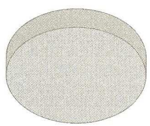
Uso por Tipo de Ligação